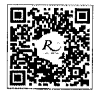
QR-Code สำหรับจองห้องพัก

โทรศัพท์: ๐๒-๔๒๒-๙๒๒๒ โทรสาร : ๐๒-๔๓๓-๕๘๘๐ E-mail : rsvn@royalriverhotel.com