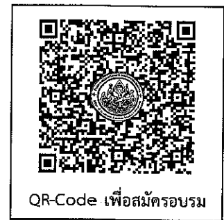
QR-Code เพื่อสมัครอบรม

หมายเหตุ กรณีผู้สมัครเข้ารับการฝึกอบรมดำเนินการชำระเงินค่าลงทะเบียนล่วงหน้า แต่ไม่สามารถมาเข้ารับการฝึกอบรมได้ กรุณาแจ้งมหาวิทยาลัยล่วงหน้าอย่างน้อย ๕ วัน หากไม่มีการแจ้งล่วงหน้าจะถือว่าท่านมีความประสงค์เข้ารับการฝึกอบรมตามปกติ