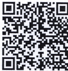
(QR Code โครงการ)