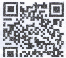
QR Code รับจองเสื้อ

ส่งหลักฐานการชำระเงินที่อีเมลล์ p.yuychim@gmail.com