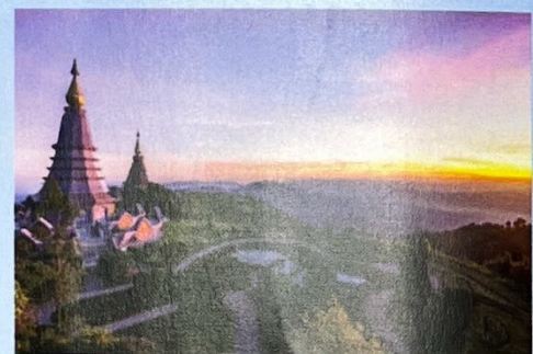
อุทยานแห่งชาติดอยอินทนนท์