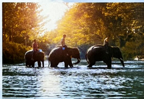
ปางช้างเชียงใหม่