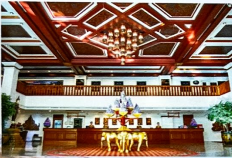
โรงแรม ที เอ็มเพรส จังหวัดเชียงใหม่