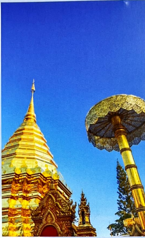
วัดพระธาตุดอยสุเทพราชวรวิหาร