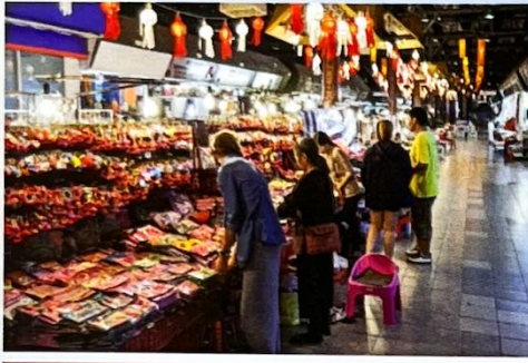
ถนนคนเดิน