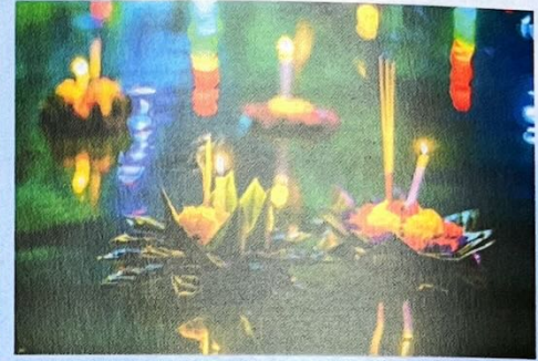
เทศกาลลอยกระทง