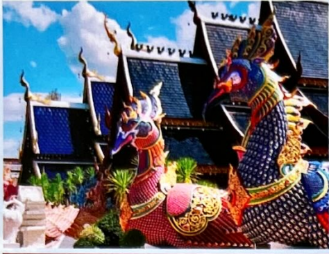
วัดบ้านเด่น